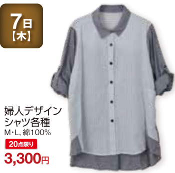
7日 [木] 婦人デザイン シャツ各種 M・L, 綿100% 20点限り 3,300円