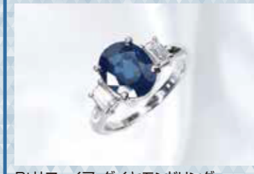
Ptサファイア・ダイヤモンドリング S=2.61ct, D=計0.90ct 現品限り 198,000円