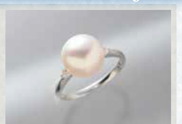
Ptアコヤパールリング 約9.0~9.5mm珠, D=計0.08ct 2点限り 77,000円