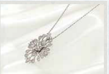
Ptダイヤモンドペンダント D=計0.65ct, 約60cmスライドネックレス 現品限り 198,000円