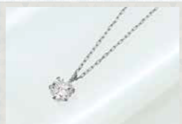
Ptダイヤモンドネックレス D=0.30ct, 長さ:約40cm 3点限り 29,700円