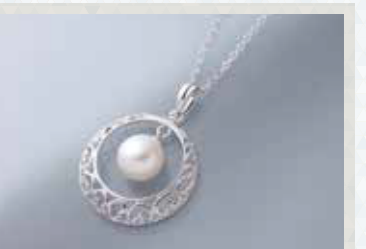
アコヤパールデザインペンダント 約8.0~8.5mm珠, 長さ:約40cm, チェーン・金具:SV 5点限り 11,000円