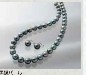
黒蝶パール ネックレス・イヤリングセット N:約8.1~10.8mm珠, 長さ:約43cm, 金具:SV, Eg:約10.8mm珠, 金具:K14WG 現品限り 220,000円