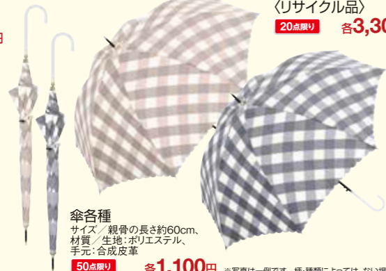
傘各種 サイズ / 親骨の長さ約60cm, 材質 / 生地:ポリエステル, 手元:合成皮革 50点限り 各1,100円 ※写真は一例です。柄・種類によっては、ない場合がございます。