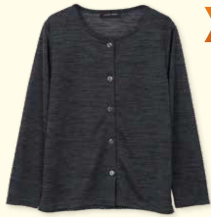
婦人カーディガン各種 M~L, 素材各種 20点限り 2,200円