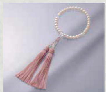
アコヤパール念珠 約7.0~7.5mm珠, 長さ:約26cm, 正絹房 5点限り 13,200円