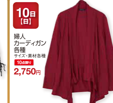
10日 [日] 婦人 カーディガン 各種 サイズ:素材各種 10点限り 2,750円