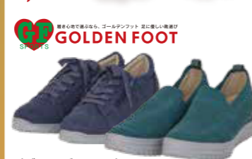
〈ゴールデンフット〉 婦人ウォーキングシューズ各種 22.5~24.5cm, 合成皮革 50点限り 各4,290円