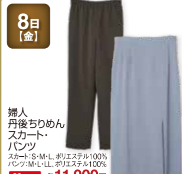
8日 [金] 婦人 丹後ちりめん スカート・ パンツ スカート:S・M・L, ポリエステル100% パンツ:M・L・LL, ポリエステル100% 20点限り 各11,000円