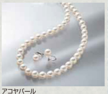
アコヤパール ネックレス・イヤリングセット N:約7.5~8.0mm珠, 長さ:約42cm, 金具:SV, Eg:約8.0~8.5mm珠, 金具:SV 2点限り 66,000円