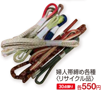
婦人帯締め各種 (リサイクル品) 30点限り 各550円