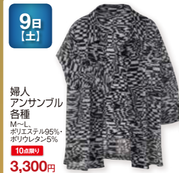
9日 [土] 婦人 アンサンブル 各種 M~L, ポリエステル95%・ ポリウレタン5% 10点限り 3,300円