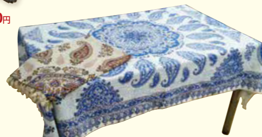
イラン製マルチカバー各種 約100×150cm, 綿100% 10点限り 各4,950円