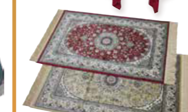
ベルギー製マット 約67×105cm, レーヨン60%・綿40% 10点限り 4,950円