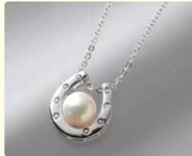
アコヤパールデザインペンダント 約8.0~8.5mm珠・長さ:約40cm, チェーン・金具:SV 10点限り 11,000円