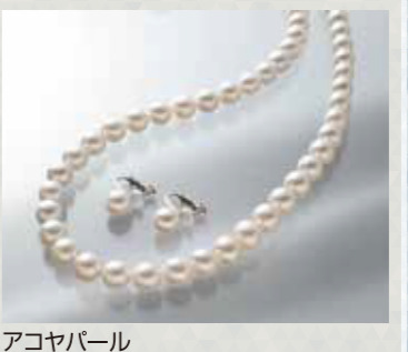
アコヤパール ネックレス・イヤリングセット N:約8.0~8.5mm珠, 長さ:約42cm, 金具:SV, Eg:約8.0~8.5mm珠, 金具:SV 2点限り 88,000円