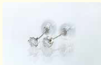
Ptダイヤモンドピアス D=計0.23ct 3点限り 13,200円