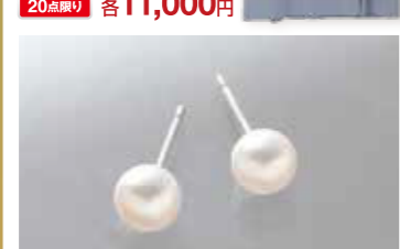
アコヤパールピアス 約5.0~5.5mm珠, 金具:K14WG 10点限り 7,700円