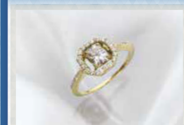
K18ダイヤモンドリング D=0.514ct, D=計0.21ct 現品限り 165,000円