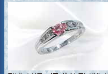
Ptピンクサファイア・ダイヤモンドリング S=0.329ct, D=計0.21ct 現品限り 165,000円