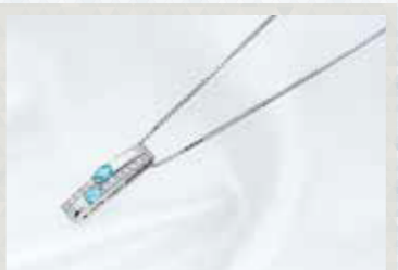
K18WGTルマリン・ダイヤモンドペンダント T=計0.19ct, D=計0.13ct, 長さ:約40cm 現品限り 113,300円